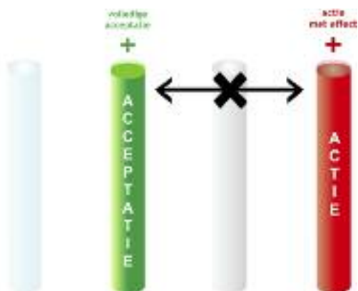
voorbeeld 'valse tegenstelling'

neigingen, waar o.a. ook ervaren leidinggevend en trainers mee worstelen. Het bleek dat bij elk van deze verwarringen steeds de uitersten van twee pijlers abusievelijk door elkaar gehaald worden.